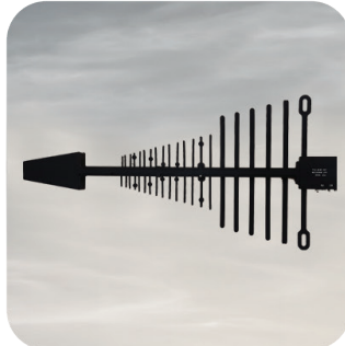
Yönlü Anten Sistemli Silah