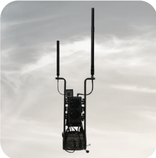
Eşyönlü Sırt Tipi Drone Savar